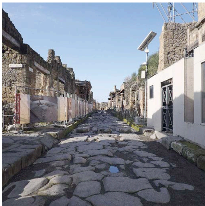
I restauri della domus di Paquio Poculo: vanno completati entro luglio. A destra: uno dei cantieri

POMPEI, FINE FEBBRAIO, ORE 16.30. Gli scavi sprofondano nel silenzio. Sarà la pioggia. Sarà che gli operai se ne sono già andati, tutti. Sarà che di turisti ne restano pochi, sparpagliati verso le uscite. Solo un custode armeggia con un mazzo di chiavi. Mancano trecento giorni alla temuta scadenza dei fondi europei; trecento giorni per spendere gli oltre cento milioni di euro del “Grande progetto” in restauri, rinforzi, ricerche. Ma tutto è ancora immerso nella più immutabile normalità: su 47 cantieri previsti, solo nove sono stati avviati e tre conclusi. Trentacinque restano ancora da aprire; e dovrebbero essere completati entro l’anno. Manca poco. Eppure uno scivolare soporoso attraverso tanto le ville romane dissepolte quanto i prefabbricati che da trent’anni ospitano “in via provvisoria” gli uffici della soprintendenza: costruiti dopo il terremoto del 1980, sono ancora lì. Correre sarebbe fondamentale, adesso: non solo perché rischiamo una figuraccia internazionale, ma soprattutto perché i soldi che non saranno spesi entro il 31 dicembre verranno decurtati dai futuri finanziamenti per questo patrimonio dell’umanità. La minaccia però non sembra smuovere la burocrazia, che fra incomprendimenti, attese e protocolli sembra pronta a schiacciare a terra anche gli ultimi sforzi di rilancio.