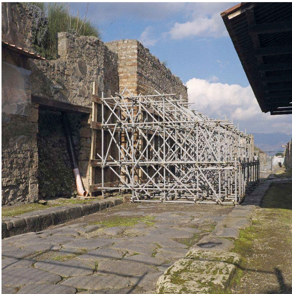
La casa dei gladiatori con le strutture di tubi innocenti contro i crolli. A destra: il cantiere dei lavori nella casa del criptoportico

Malgrado gli ostacoli e le resistenze, i primi risultati iniziano a farsi vedere: a fine 2014, otto mesi dopo l'insediamento della nuova squadra, le gare in corso sono passate da nove a 19, quelle bandite da 14 a 31 e i cantieri avviati sono raddoppiati. Interi quartieri dell'antica città sono stati recintati per essere rafforzati dalle fondamenta. Certo, guide e turisti sono abituati a zigzagare fra le transenne, ma ora dietro le reti non si vedono più solo frammenti d'intonaco a